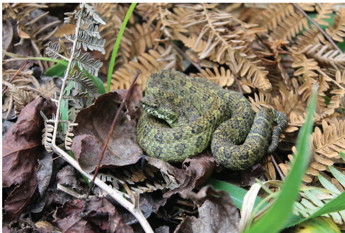
Figura 1. Ejemplar de Ophryacus smaragdinus de la localidad de Xico Viejo.

una altura no mayor a 1.50 m. Todos los registros fueron obtenidos durante el día entre las 09:40 y 16:30 h, en un intervalo altitudinal que va desde los 1619 a los 2199 msnm (Cuadro 1).