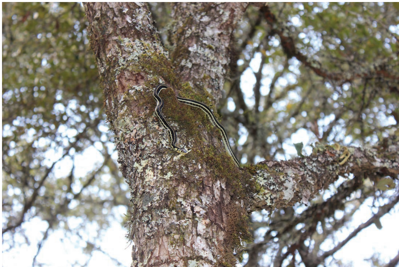
Figura 1. Ejemplar de Thamnophis pulchrilatus observado en árbol de encino a 4.96 m del suelo.