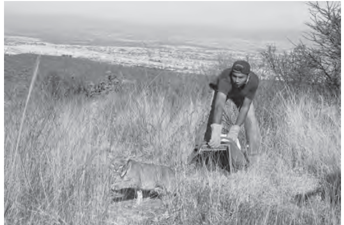
Figura 2. Macho de gato montés capturado en el parque nacional El Cimatario, se observa en el fondo la ciudad de Querétaro.

La abundancia calculada fue de 3 \pm 0.78 individuos con una probabilidad de captura de 0.1, para una densidad mínima de 0.17 ind/km 2 . La probabilidad de captura documentada es la recomendada como una medida de sensibilidad del modelo usado (Harmsem et al. 2011). La densidad mínima reportada para este estudio es compa-