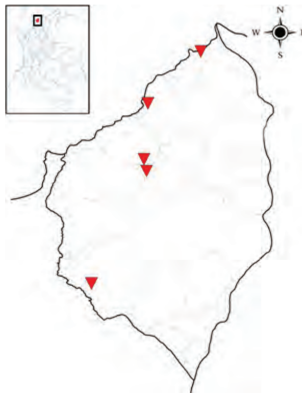
Figura 1. Ubicación de los Fragmentos de Bosque seco Tropical, muestreados en el departamento del Atlántico.

Muestreos. La recolecta del material se realizó entre diciembre de 2012 y agosto de 2013 en cinco fragmentos de Bosque seco Tropical del departamento del Atlántico (Cuadro 1). Se recolectaron los adultos fitófagos de Scarabaeidae con ayuda de trampas de luz blanca y ultravioleta, que se colocaron en cada sitio alternadamente y operaban desde las 18:00 hasta las 6:00. Adicionalmente, se realizó