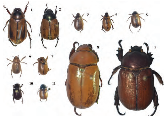
RUTELINAE. (1) Paranomala inconstans , (2) Paranomala sp1, (3) Paranomala sp2, (4) Paranomala sp3, (5) Paranomala sp4, (6) Leucothyreus sp1, (7) Leucothyreus sp2, (8) Pelidnota polita , (9) Xenopelidnota anomala (10). Leucothyreus sp3, (11) Leucothyreus sp4.