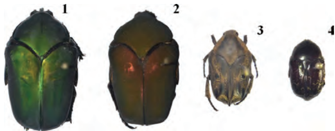
CETONIINAE. (1) Cotinis barthelemyi , (2) Cotinis lebaasi , (3) Hoplopyga liturata , (4) Euphoria yucateca