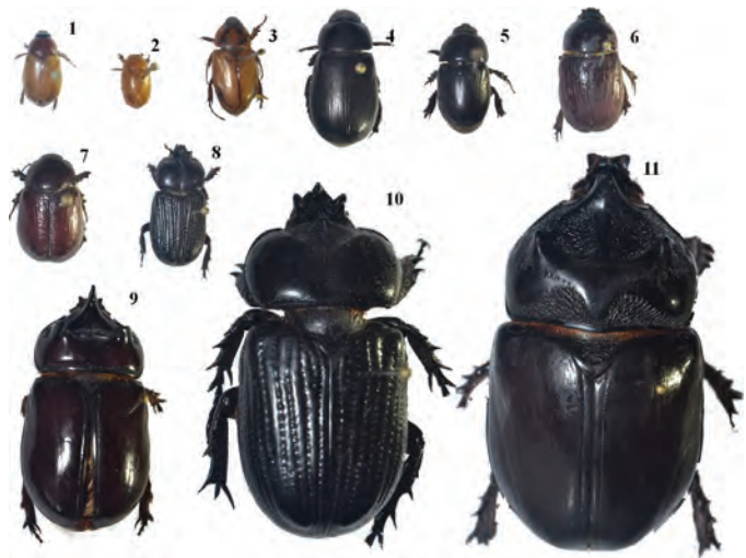
DYNASTINAE. (1) Cyclocephala melanocephala , (2) Cyclocephala ovulum , (3) Cyclocephala sp, (4) Dyscinetus dubius , (5) Euetheola humilis , (6) Tomarus cuniculus , (7) Tomarus fossor , (8) Hemiphileurus sp, (9) Strategus aloeus , (10) Phileurus didymus , (11) Strategus jugurtha .