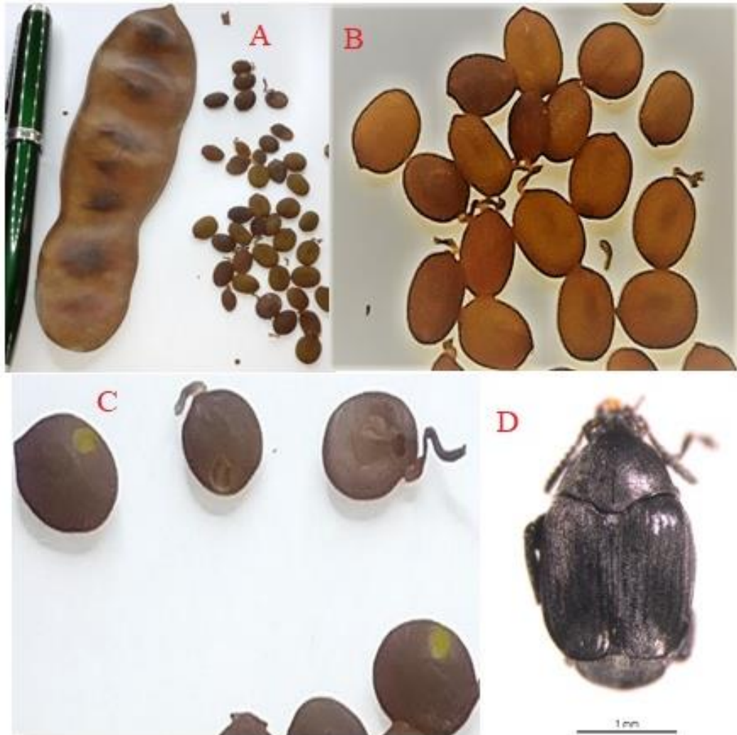
Figura 1. (A) Vainas y semillas de Senegalia polyphylla , (B) semillas sanas, (C) semillas con orificio de salida del insecto, (D) adulto de Stator aegrotus .

del suelo. El bajo índice de semillas depredadas encontradas en este estudio puede estar relacionado con la recolecta de frutos en fechas tempranas de la caída natural, pues en la medida que aumenta la cantidad de frutos en el suelo, el nivel de semillas infestadas será mayor, y en ese intervalo de tiempo todas las larvas ya habrán completado su desarrollo iniciando así un nuevo ciclo biológico de S. aegrotus .