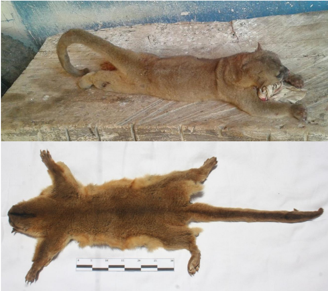
Figura 2. Muestra al ejemplar al día siguiente de ser cazado (parte superior) y se observa la piel curtida del mismo (parte inferior).