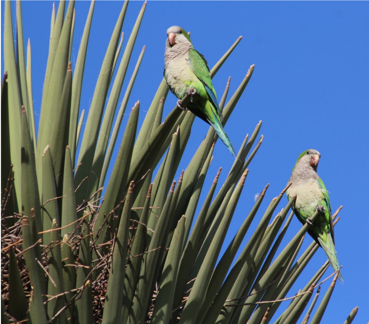
Figura 1B. Individuos de cotorra argentina en una yuca ( Yucca filifera ) con nido.

Los sitios de presencia de individuos de la especie, así como de nidos fueron georreferenciados y documentados fotográficamente.