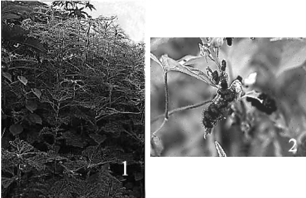
Figuras 1 y 2

Verbenaceae entre las más importantes (Arnett 1968, Anaya 1987). Una de las especies de esta subfamilia de importancia económica es la "catarinita de la papa" ( Leptinotarsa decemlineata Say) que es la principal plaga de este cultivo en algunas partes del mundo (Gimingham 1950, Gauthier et al. 1981, Bartlett & Murray 1986, Casagrande 1982).