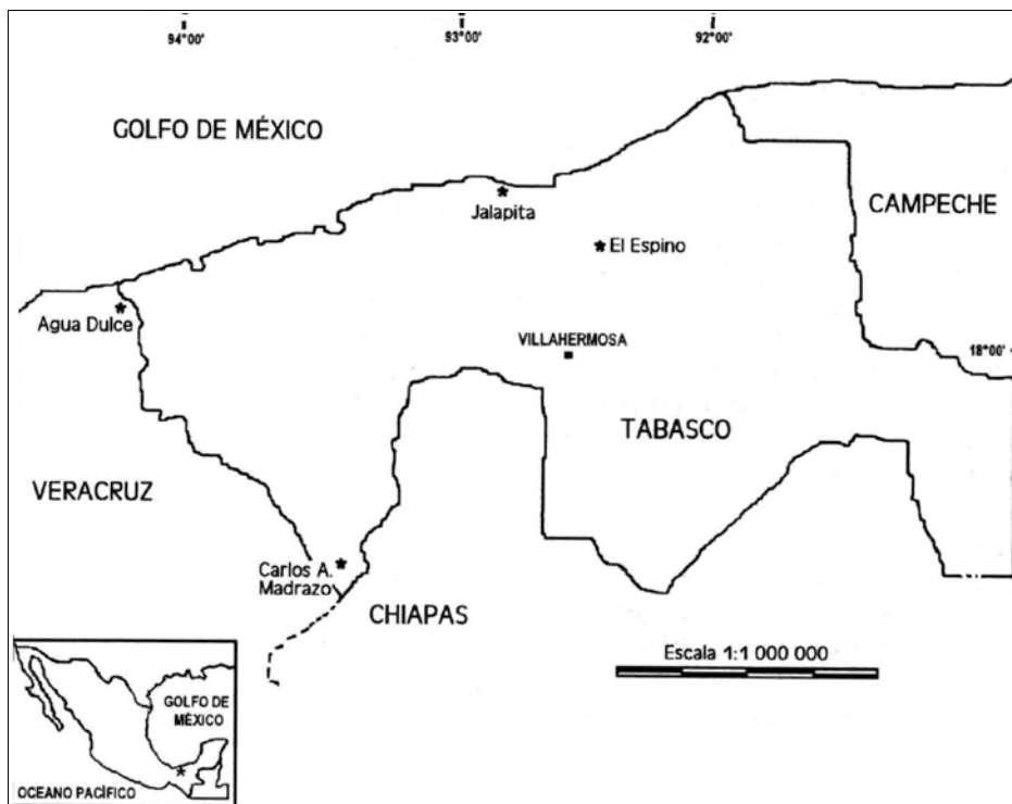
Figura 1 Localización de las cuatro áreas de estudio en el sureste de México.

39.729°W; 3) el ejido Jalapita del municipio de Centla, Tabasco, 18° 24.987'N, 93° 00.024'W, y 4) el ejido El Espino del municipio de Villahermosa-Centro, Tabasco, 18° 14.677'N, 92° 50.083'W (Fig. 1). En Agua Dulce, Jalapita y El Espino el clima es cálido-húmedo con lluvias en verano, mientras que en Carlos A. Madrazo el clima es cálido-húmedo con lluvias todo el año. En las cuatro áreas de estudio la temperatura promedio oscila entre 20 y 30 °C. La precipitación pluvial promedio varía de 60 mm en el mes más seco (abril) hasta 2,300 mm en septiembre, que es el mes más húmedo (García 1989).