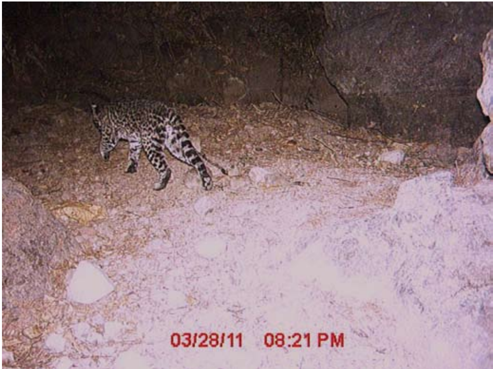
Figura 2. Registro de ocelote ( L. pardalis ) en Selva Baja Subcaducifolia.

relevancia ecológica para la conservación de la biodiversidad de la fauna presente en la región.