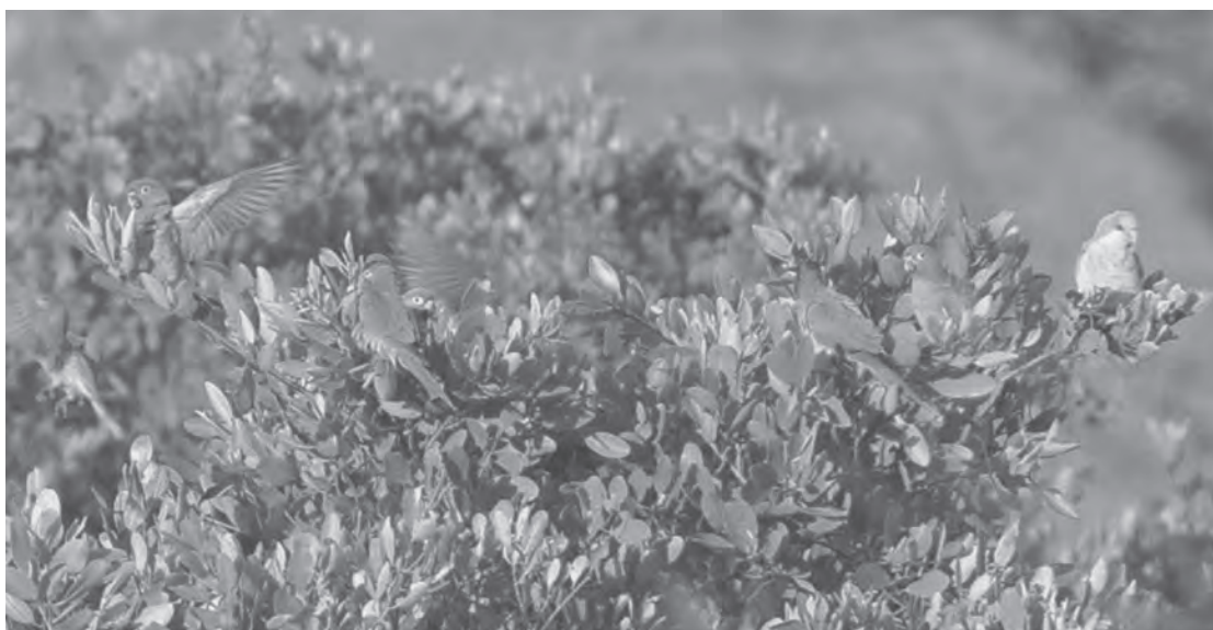
Figura 3. Cotorra argentina ( Myiopsitta monachus ) en árbol de percha nocturna, entre una parvada de pericos pecho sucio ( Eupsittula nana ), noviembre de 2013.

Veracruz, el más cercano es los Islotes del río Jamapa, a 53 km al noroeste de Alvarado, con hasta siete individuos (eBird 2015). La cotorra argentina fue el psitácido más exportado de América hasta el 2005 y México su principal importador (Pineda-López & Malagamba-Rubio 2011, CITES 2015, Pericos Mexicanos en Peligro 2015). Al escapar han formado colonias reproductivas en varios estados (MacGregor-Fors et al. 2011, Ramírez-Albores