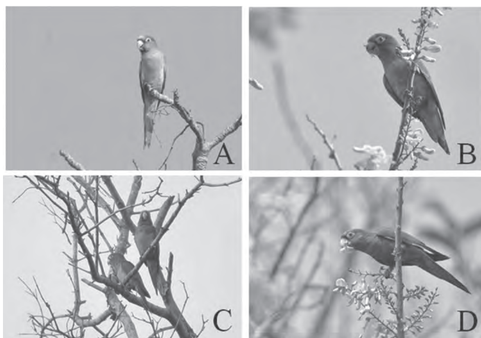
Figura 4. Perico frente naranja ( Eupsittula canicularis ). A) diciembre 2011, B) febrero 2012, C) septiembre 2013, D) febrero 2014. En B) y D) se alimenta de flores de cocuite ( Gliricidia sepium ).

El perico frente-naranja es nativo del occidente de México, asociado a bosque tropical caducifolio, y su distribución potencial indica que ha habido una reducción de hábitat en las últimas décadas (Ríos-Muñoz & Navarro-Sigüenza 2009), aunque es el psitácido del Pacífico que más ha conservado su distribución original (Marín-Togo et al. 2012). Se ha registrado como escape en varios estados, incluso del centro de México (Peterson & Navarro-Sigüenza 2006, Ramírez-Albores & Chapa-Vargas 2015), pero no ha proliferado. Hay otros registros en la vertiente del Golfo entre los años 2003 y 2011 con hasta 30 individuos (eBird 2015): en Veracruz (Pantano de Santa Alejandrín en Minatitlán, a 143 km al sureste de Alvarado), en Oaxaca (Valle Nacional, Tuxtepec y camino a Tehuantepec) y en Chiapas (Palenque). No detectamos nidos o sitios de pernocta, pero la frecuencia observada, su presencia en el manglar y la abundancia de hasta 17 individuos/día, indican su establecimiento en los humedales. Hay factores que favorecerían su reproducción: a) la abundancia de termiteros en el manglar y árboles de zonas inundables y cultivos, ya que para ambos Eupsittula son su principal sustrato para anidar y E. canicularis ha ocupado termiteros en ambientes alterados (Palomera-García 2010, Marín-Togo et al. 2012), b) la disponibilidad más constante de recursos alimenticios en el manglar, zonas