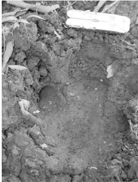
Figura 3 Fotografía del registro de huella del tapir centroamericano en el área de estudio.